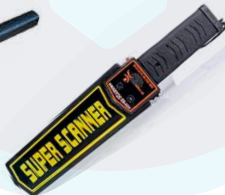
DETECTOR DE METAL SUPER SCANNER