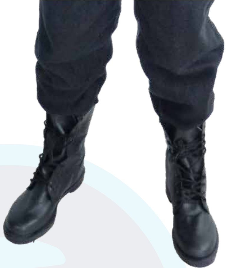
BOTA MILITAR SENCILLA