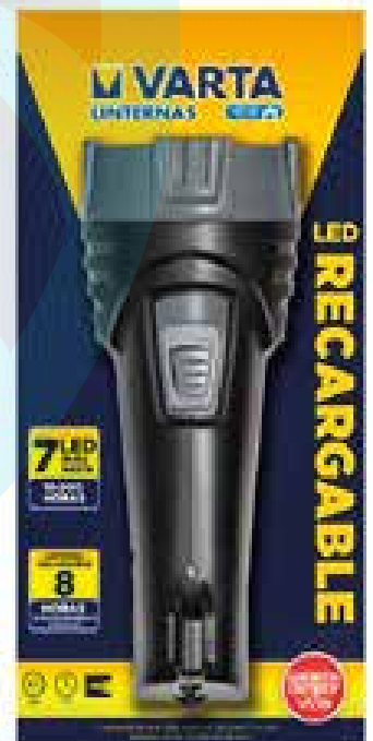
LINTERNA 7 Ó 11 LED VARTA RECARGABLE