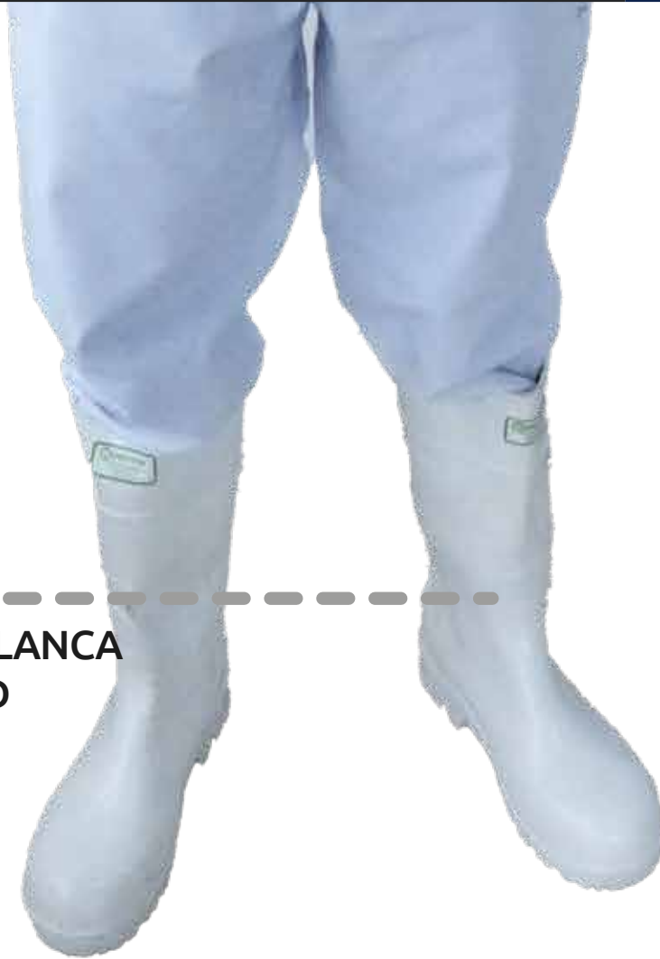
BOTA DE CAUCHO BLANCA DE SEGURIDAD