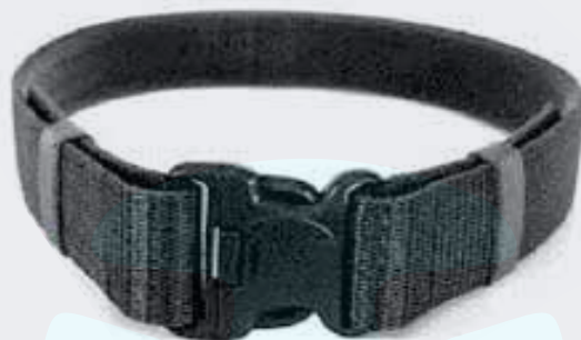
REATA DE 55 MM CON CHAPA PLASTICA Y HERRAJE METALICO