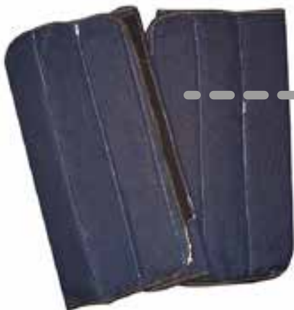
CANILLERA EN CARNAZA