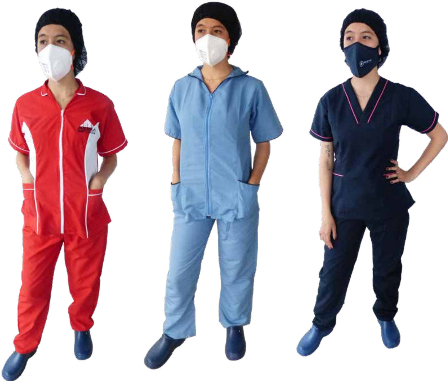
CONJUNTO 2 UNIFORMES - ROPA DE TRABAJO Y CALZADO