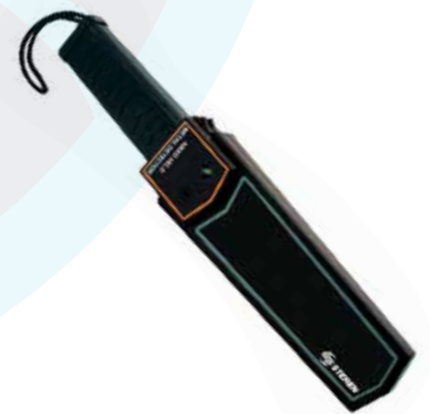
DETECTOR DE METAL STEREN