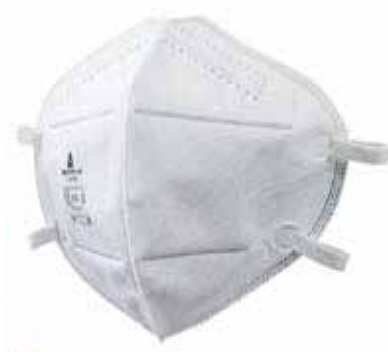
RESPIRADOR LIBRE MANTENIMIENTO DE FIBRA SINTETICA NO TEJIDA 7000PN 7001 MOLDEX