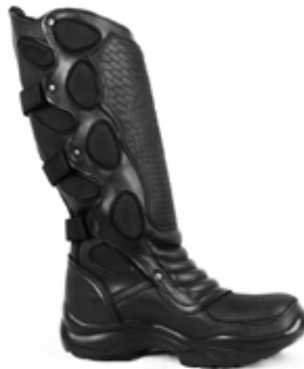
BOTA FULL PROTECCIÓN