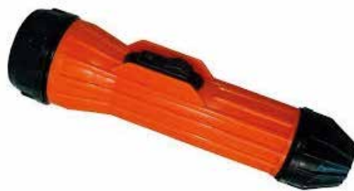
LINTERNA INTRINSICAMENTE SEGURA