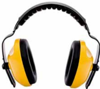
PROTECTOR AUDITIVO TIPO COPA EN DIADEMA 25DB