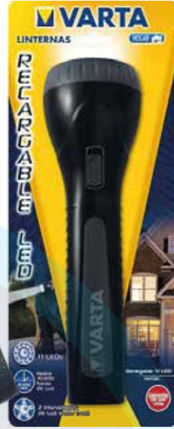
LINTERNA 11 LED VARTA RECARGABLE