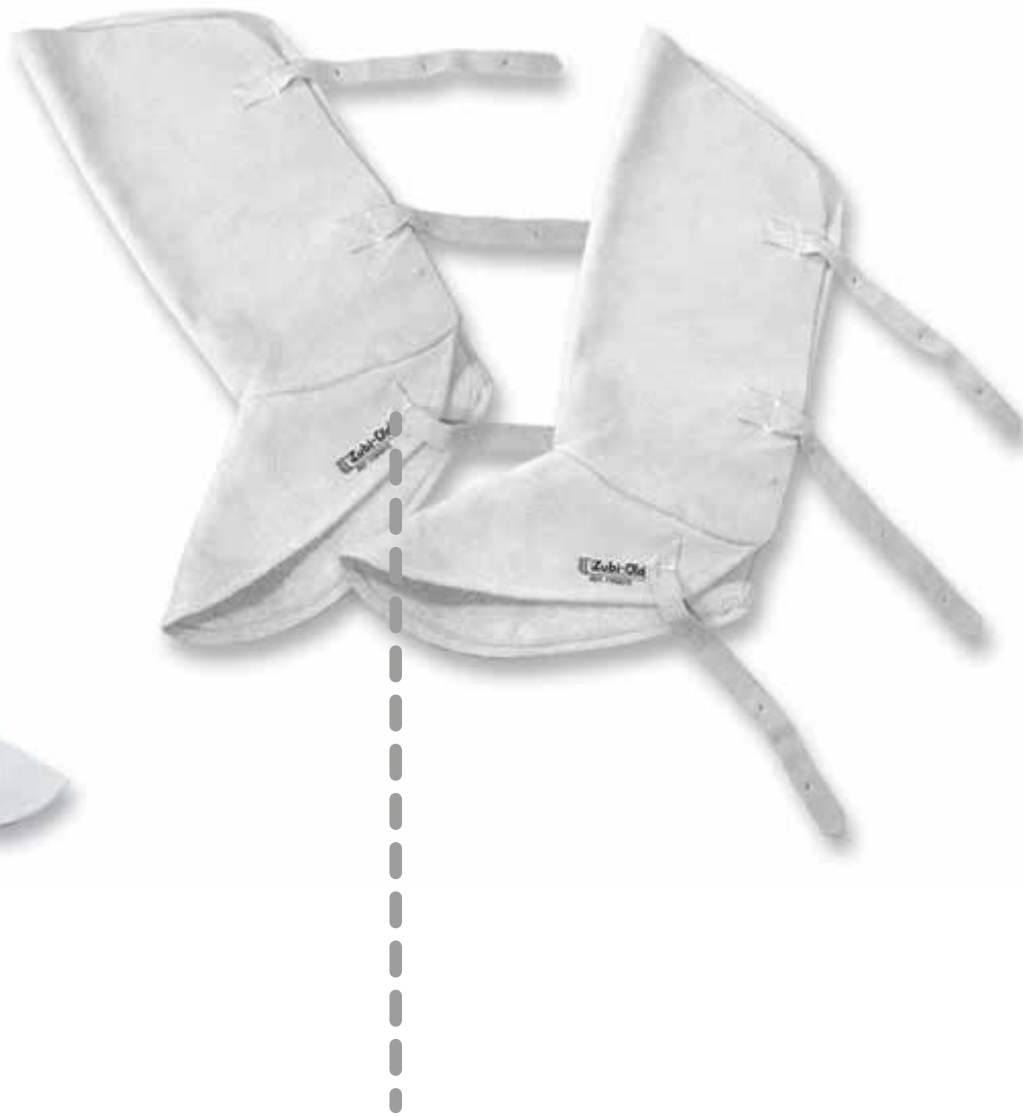
POLAINAS EN CARNAZA