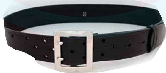
CORREA EN CUERO DE 5 CM