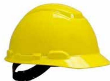
CASCO DE SEGURIDAD BENGALMARCA ARSEG