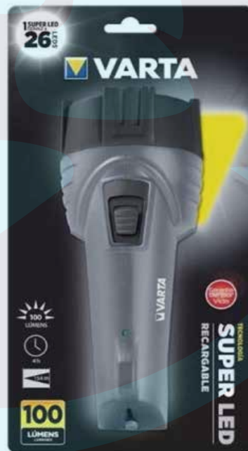
LINTERNA RECARGABLE VARTA 100 ò 35 LUMENS 26 ò 9 LED