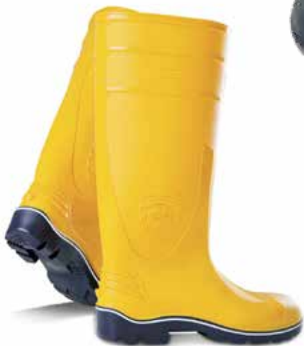
BOTA DE CAUCHO CON PUNTA DE ACERO SUPERSAFETY 7 VIDAS