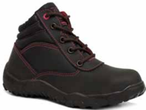
BOTA DIELECTRICA LADY WORKER