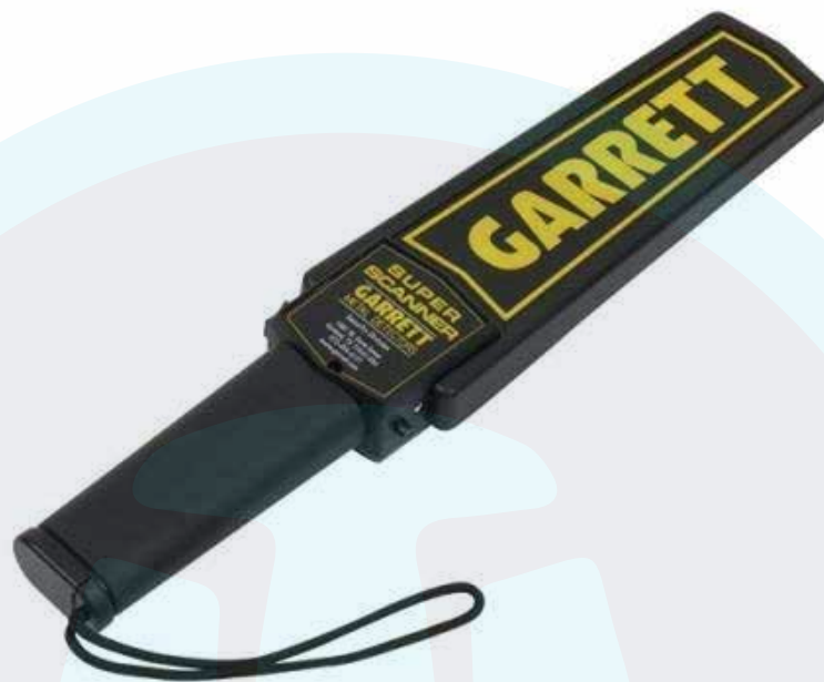
DETECTOR DE METAL GARRET ORIGINAL