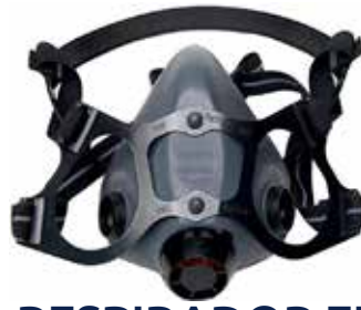
RESPIRADOR EN ELASTOMERO 550030M NORTH