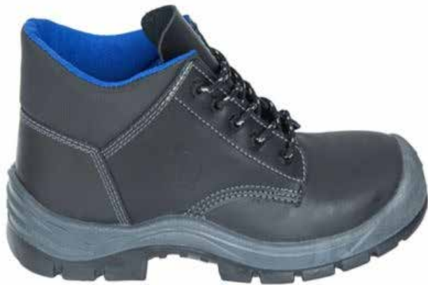
BOTA DIELECTRICA OPERATIVO