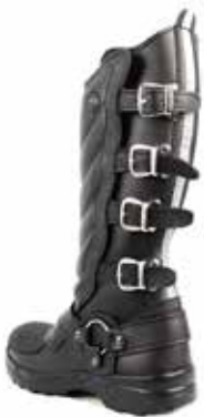
BOTA ESPINA PESCADO