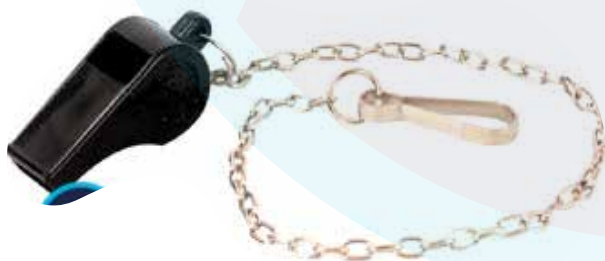
SILVATO PLASTICO CON CADENA