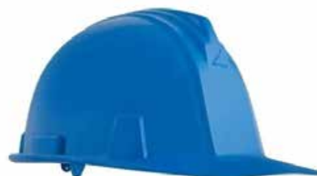
CASCO BUNKER DIELECTRICO CON REACHET