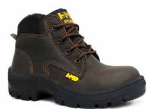
PLUMA CUERO GRASO