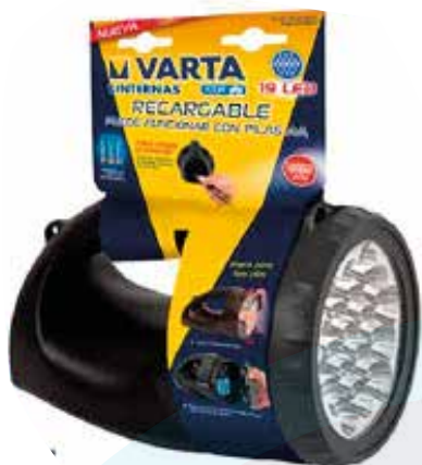
LINTERNA 19 y 12 LED VARTA RECARGABLE