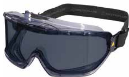
GAFAS PANORAMICAS DE POLICARBONATO CLARAS Y OSCURAS