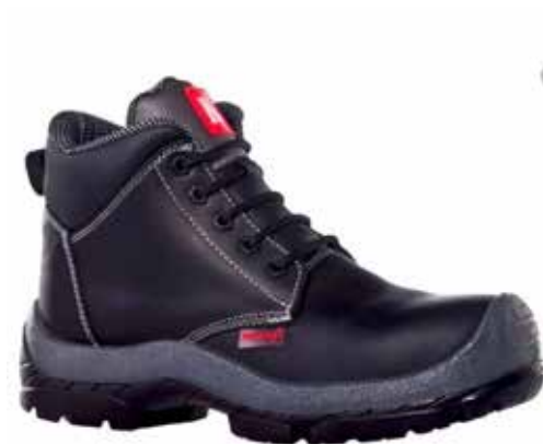
BOTA DIELECTRICA INDIANA