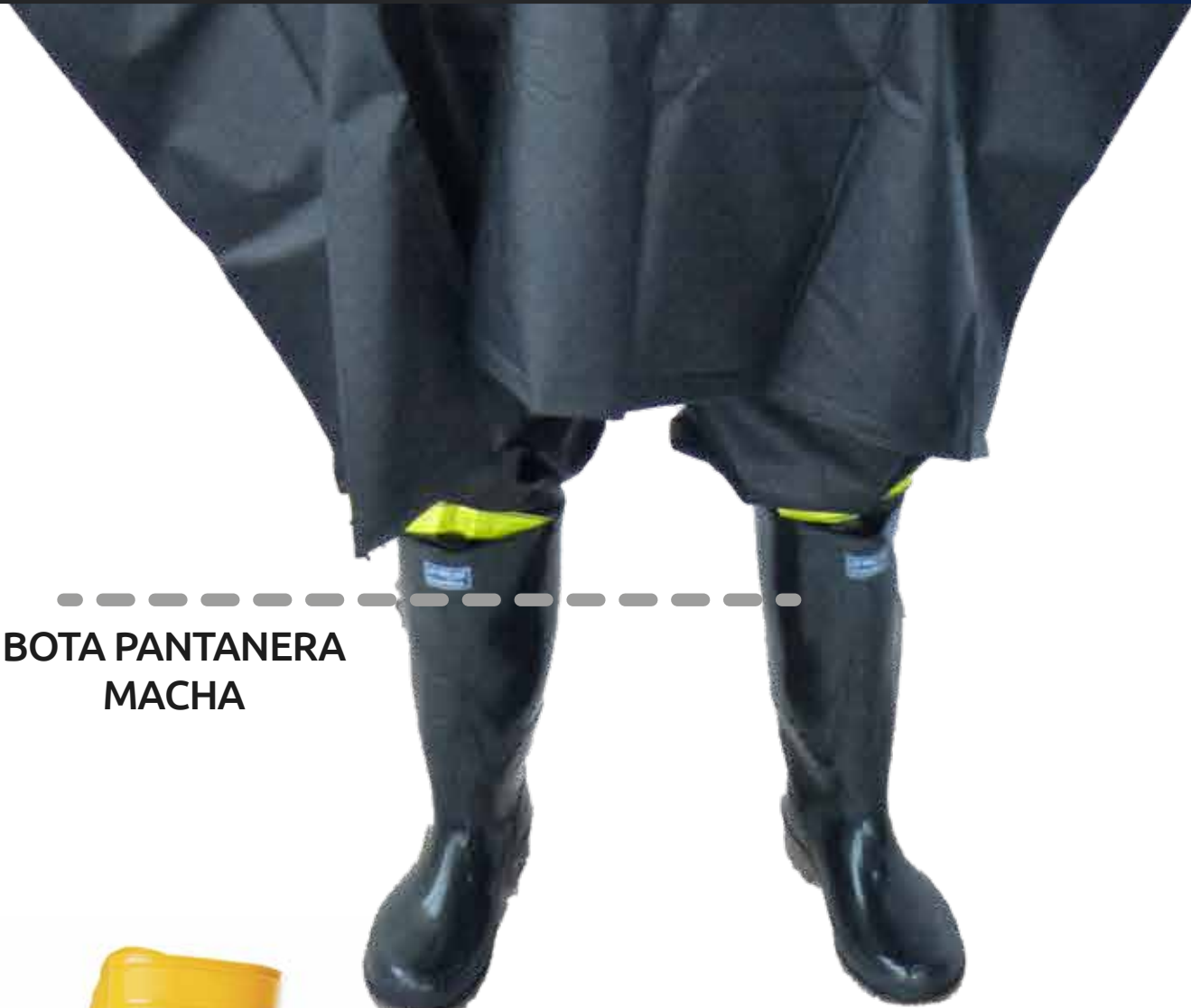
----- BOTA PANTANERA MACHA