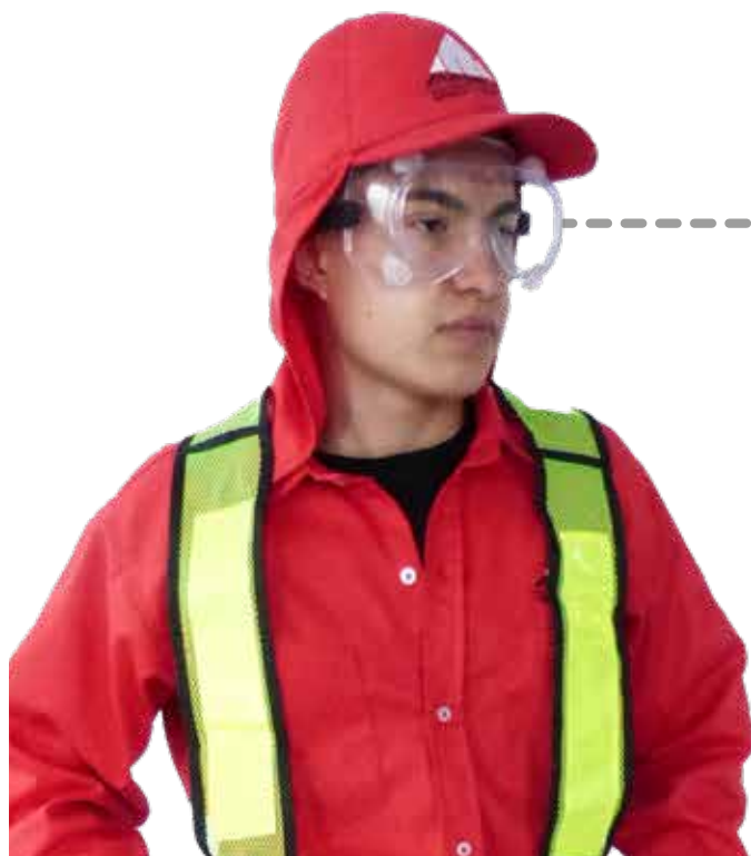
GAFAS PANORAMICAS DE POLICARBONATO INCOLORO. VENTILACION DIRECTA - DELTA