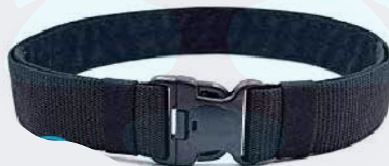
REATA DE 55 MM CON RIBETE CON CHAPA PLASTICA