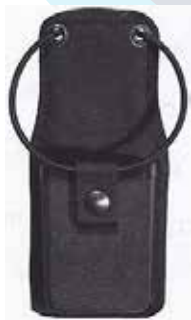
PORTA SPEED LOADER