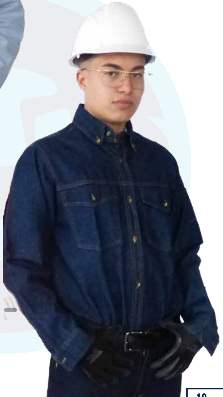
CAMISA EN JEAN