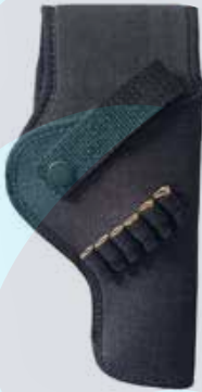
CHAPUZA EN LONA REVOLVER 38