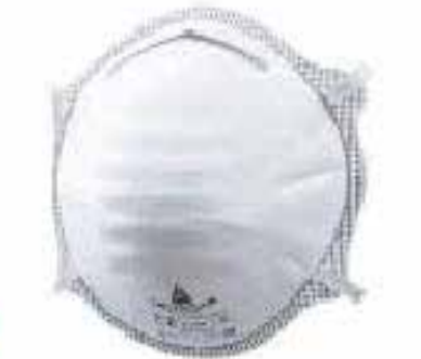
RESPIRADOR LIBRE MANTENIMIENTO, FORMA CONVEXA. N95- FFP2