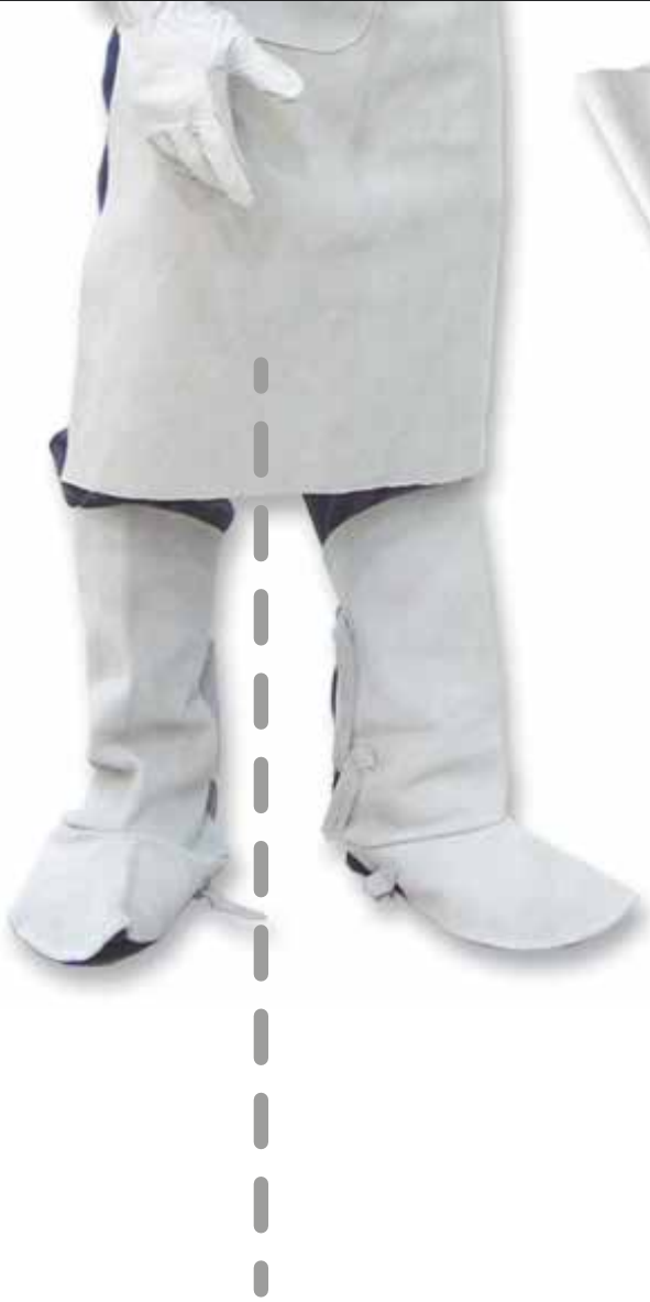
DELANTAL EN CARNAZA