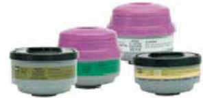
CARTUCHO P/VAPORES ORGANICOS NORTH 7500-1