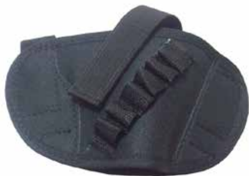
CHAPUZA EN LONA TIPO CORTUGA CON VELCRO