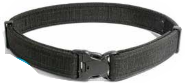
REATA EN LONA TACTICA