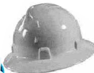
CASCO IMPERIO DIELECTRICO CON RACHET