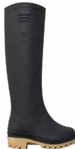
BOTA DE CAUCHO SENCILLA