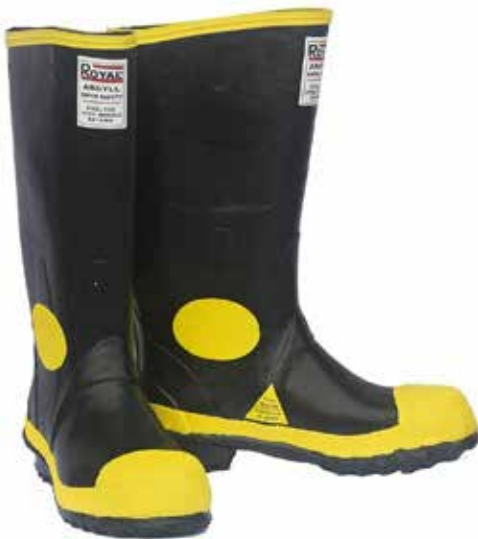
BOTA DE CAUCHO AGRYLL