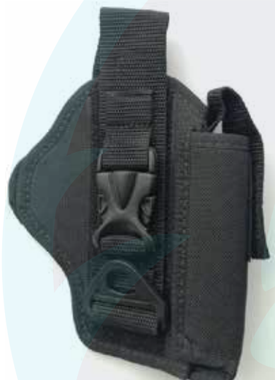
CHAPUZA EN LONA PARA PISTOLA