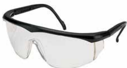
GAFAS DE POLICARBONATO