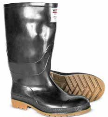
BOTA WORKMAN PUNTA DE ACERO