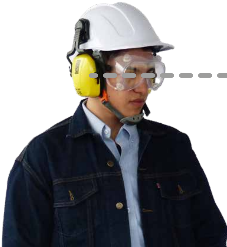
PROTECTOR AUDITIVO TIPO COPA PARA INSERTAR EN CASCO 25DB