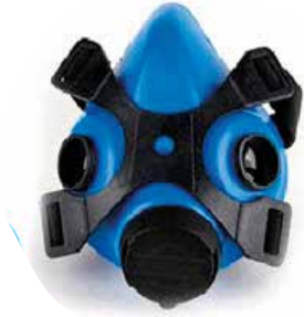
RESPIRADOR M500 MASPRTOT