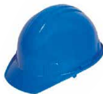
CASCO INDUSTRIAL ARMADURA