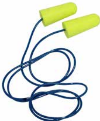
PROTECTOR AUDITIVO SPEED