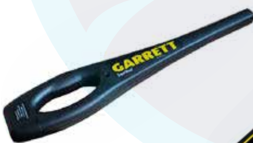
DETECTOR DE METAL SUPER WAND