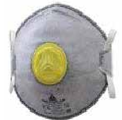
MASCARILLA LIBRE MANTENIMIENTO. LAMINA NASAL DE AJUSTE, CON VALVULA DE EXHALACION