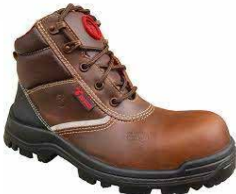
TIPO INGENIERO. CUERO HIDROFUGADO GRASO