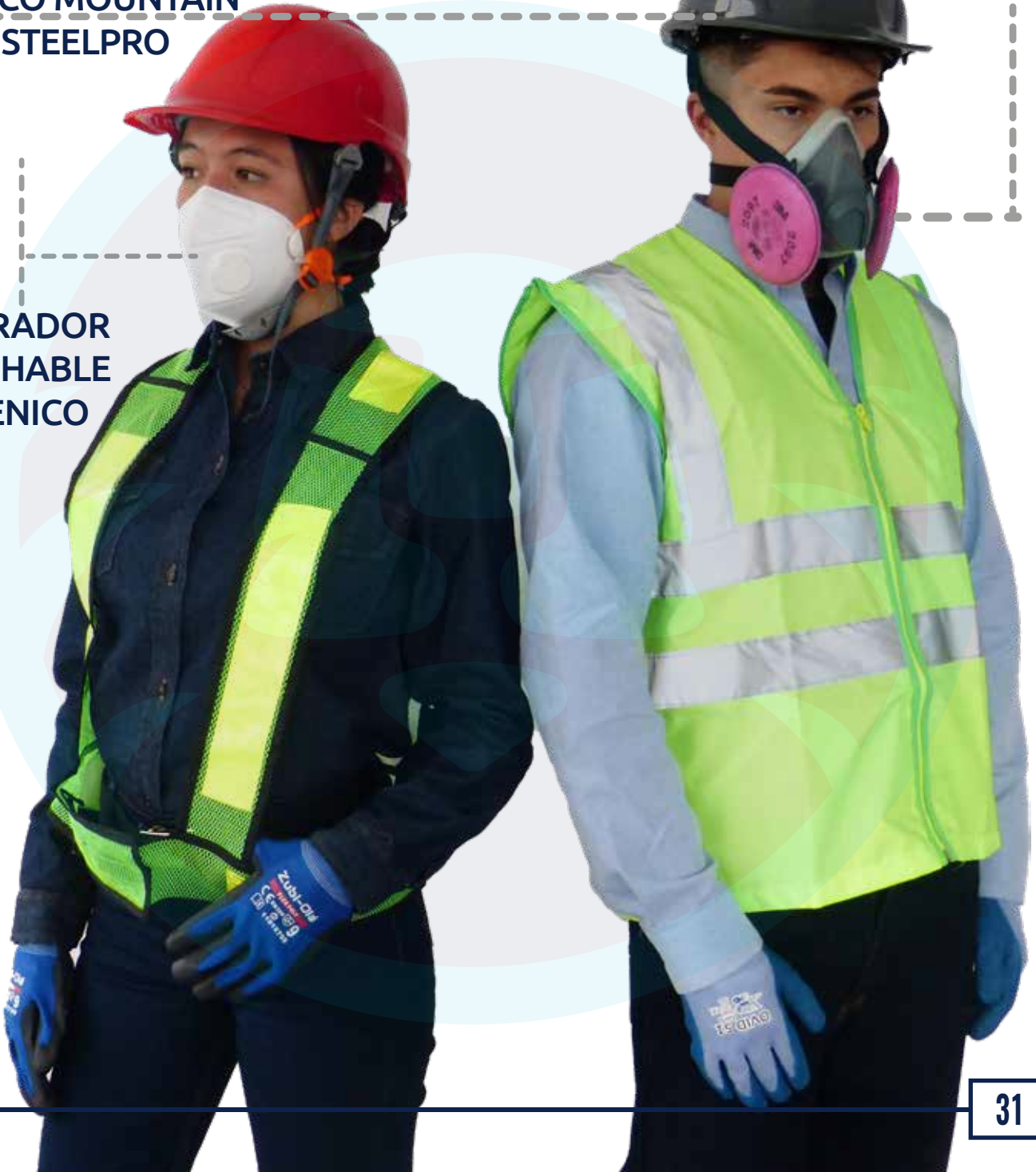
RESPIRADOR DESECHABLE HIGIENICO