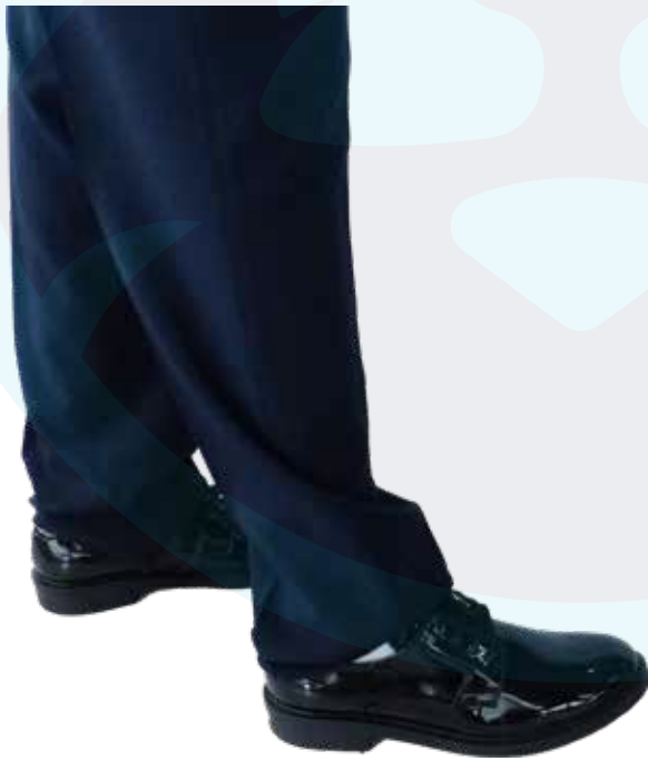
ZAPATO CHAROL OFICINA