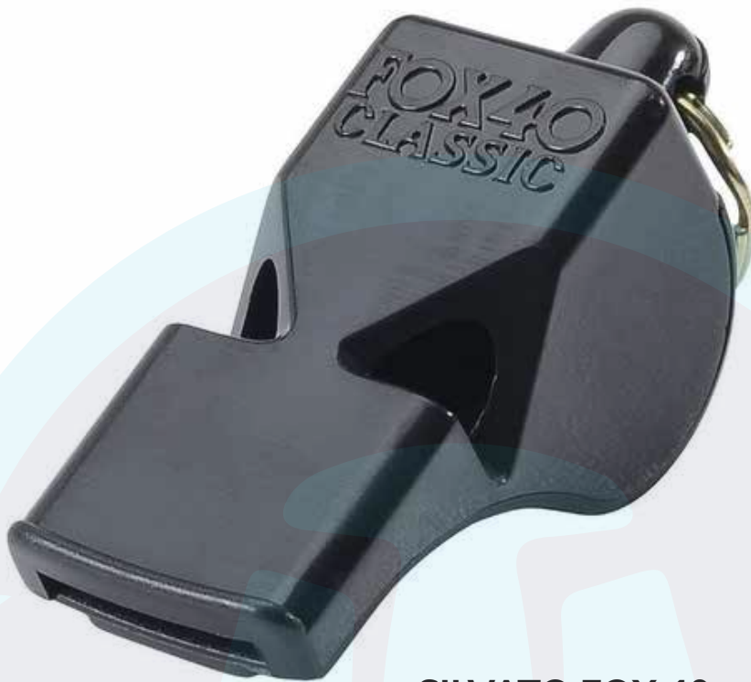
SILVATO FOX 40