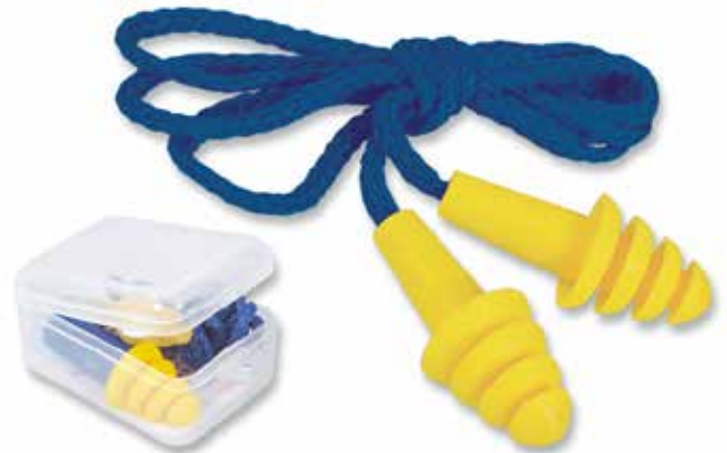
GAFAS PANORAMICAS DE POLICARBONATO CLARAS Y OSCURAS