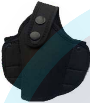
CHAPUZA GAS PIMIENTA